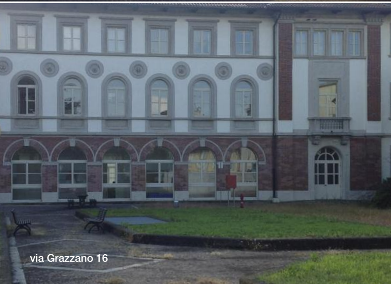
via Grazzano 16

La Notte dei ricercatori è un'occasione straordinaria per avvicinare, in modo divertente, il pubblico di ogni età al mondo della ricerca, per aprire uno spazio di incontro e dialogo con i cittadini e per sensibilizzare i giovani sul valore della scienza e del sapere.