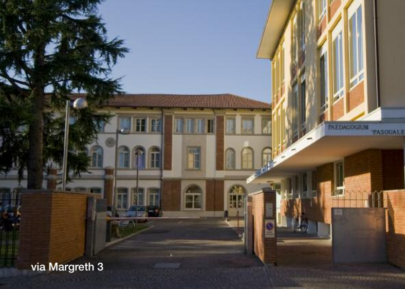
via Margreth 3